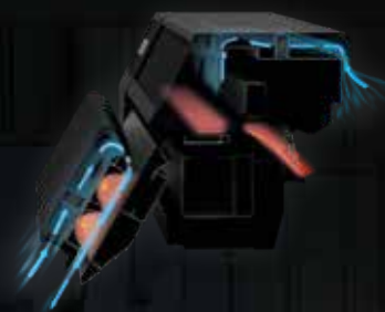
Heizung mit Anti-Staub-Design