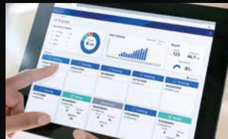
Epson Cloud Solution PORT

Drei Epson Technologien – Halbtonmodul, LUT und Microweave, reduzieren Körnung und Streifenbildung und sorgen so für eine optimale Druckqualität. Die kontrollierte Aushärtung sorgt in Kombination mit langlebigen PrecisionCore Micro TFP-Druckköpfen für eine zuverlässige Farbkonsistenz über die gesamte Produktion. Neudrucke aufgrund inkonsistenter Farben sind damit nicht mehr erforderlich.